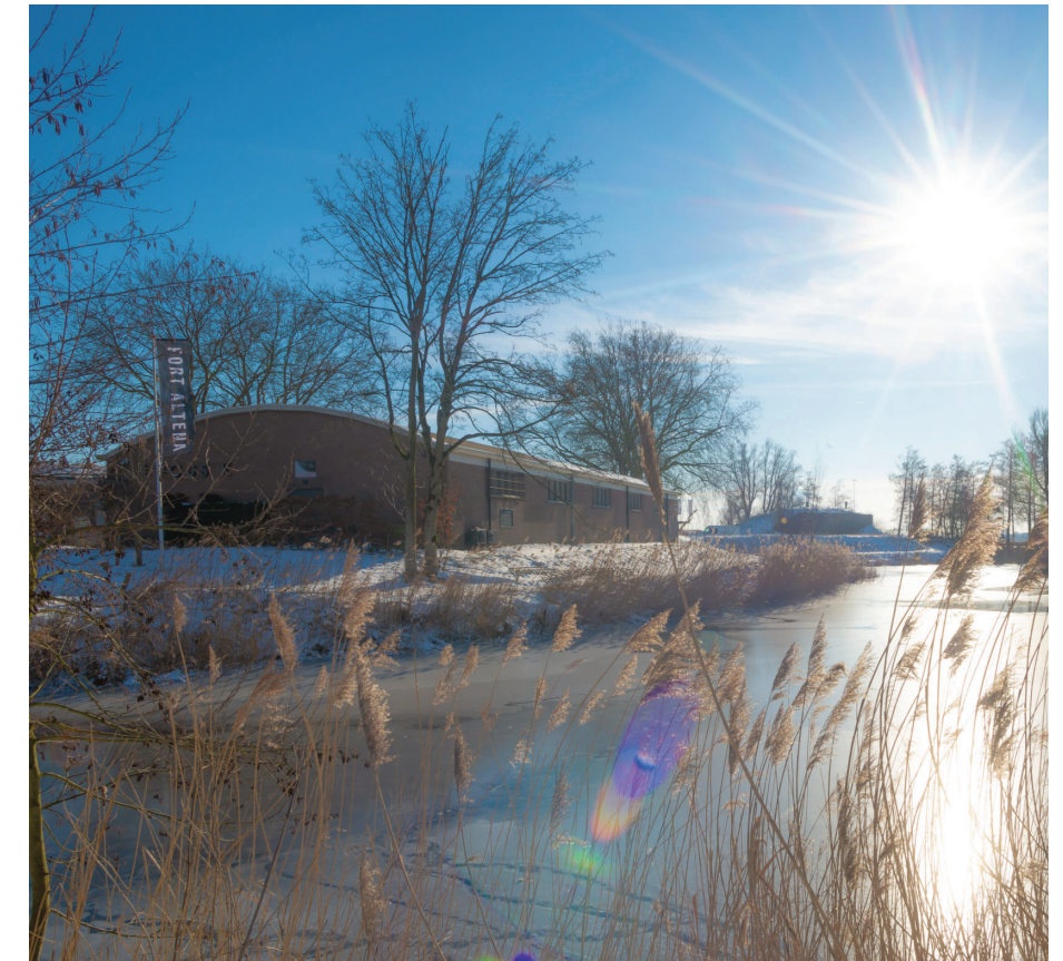
Linkerpagina, boven: Varen in de winter. Linkerpagina, onder: Natuurpoort MuseumEiland.

Nét buiten de Biesbosch ligt Natuurpoort Fort Altena. Dit fort is als onderdeel de Nieuwe Hollandse Waterlinie en UNESCO Werelderfgoed. Het fort verloor 50 jaar geleden zijn officiële verdedigingsfunctie. Tegenwoordig is het een Natuurpoort. Tijdens een bezoek aan het fort kun je de interactieve expositie bezoeken in het rondfort over de geschiedenis en natuur in de omgeving, oude kazematten verkennen